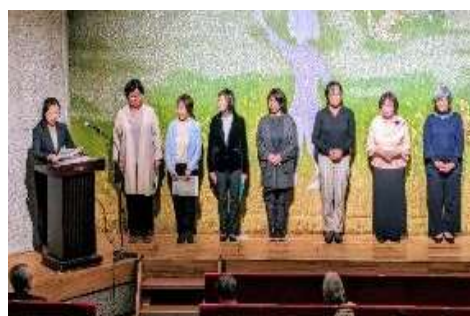
司会グループメンバー紹介 こぶし朗読の会で鍛えた話術により 演目を紹介および手話による同時説明