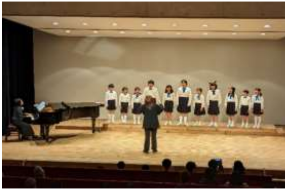
豊玉小学校合唱団 会場の皆さんも元気一杯貰いました