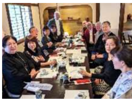
食事会場椅子席で皆さんと和気藹々で親睦を図りました