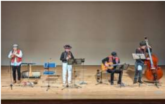
カンチャイモコのアンデス演奏 ペリ...