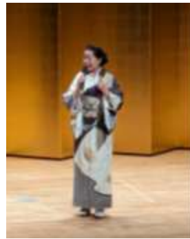
詩吟 新体詩 管野 舞龍