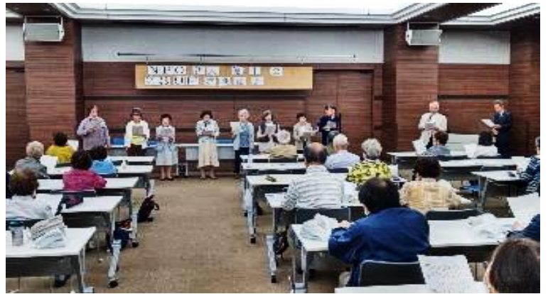
全員で最後に合唱