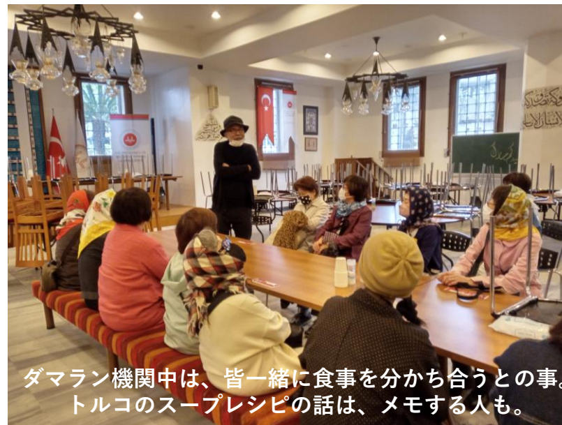
ダマラン機関中は、皆一緒に食事を分かち合うとの事。 トルコのスープレシピの話は、メモする人も。