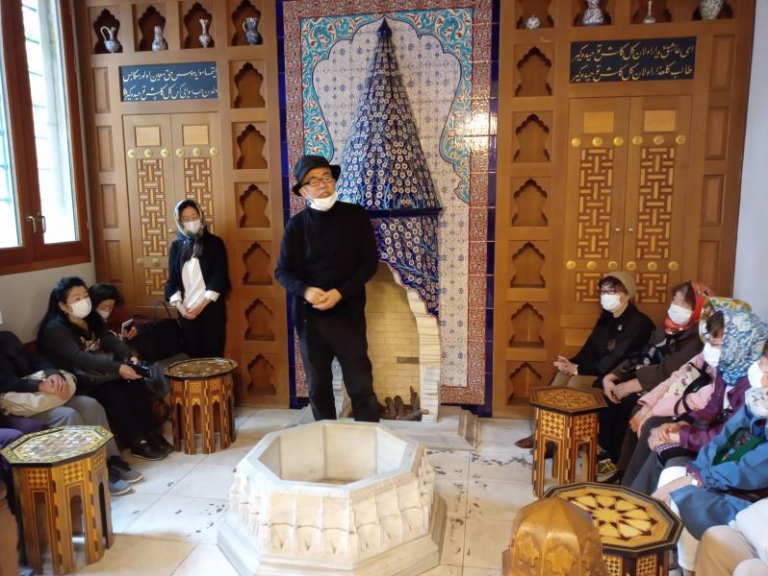
暖炉と噴水のある待合室で館長さんのお話