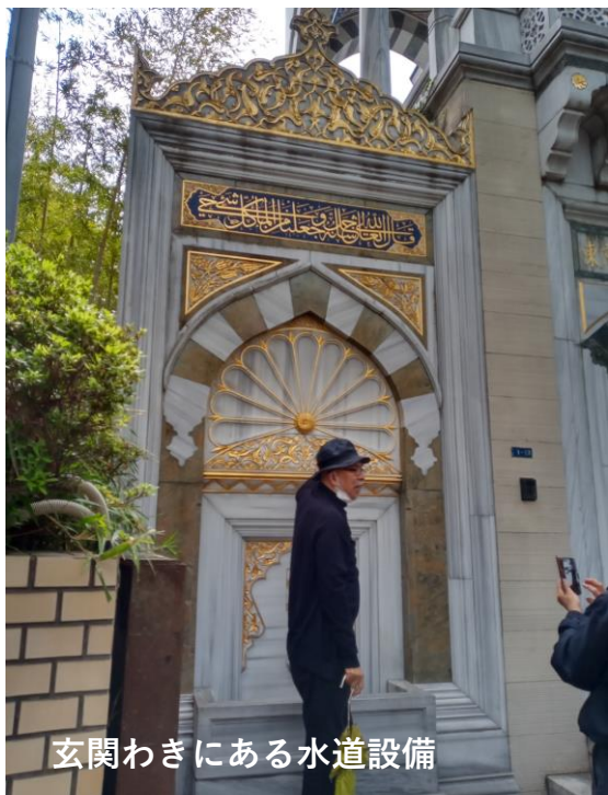
玄関わきにある水道設備