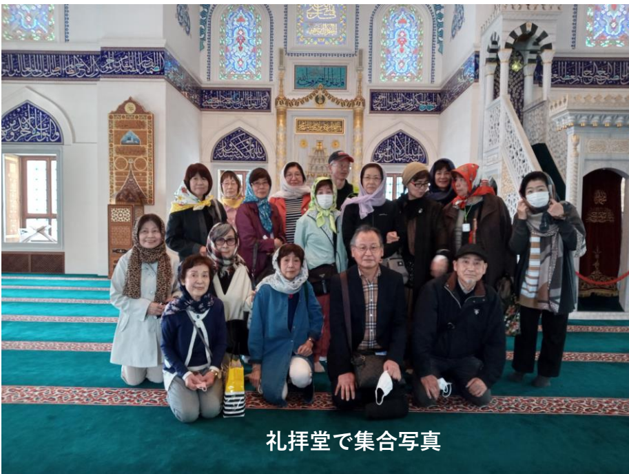
礼拝堂で集合写真