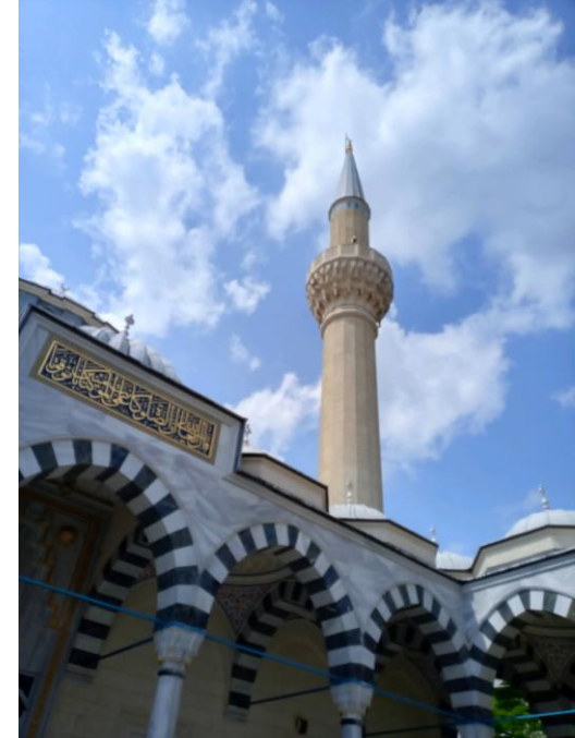
高くそびえる尖塔（ミナレット）

美しく色づくステンドグラス、天井につるされたシャンデリア、一面に敷かれたトルコブルーの絨毯、コーランの一説が描かれているドームの天井と壮大で美しい空間でした。ちょうど礼拝の時間で、皆さんメッカの方向を向いて、横一直線に並び、お祈りしていました。静かな中でコーランを読む声も響き、イスラム世界満喫でした。子供たちも学校からお祈りの時間には、ちゃんとモスクにやってきて大人たちと一緒に祈りを。男性は1階で、女性は2階で別れてお祈りとの事。イスラム教では、仏教と異なり仏像のヨブな概念がないので、聖地メッカの方向を向いてお祈りするそうです。壁には、チューリップの図柄があちこちに。