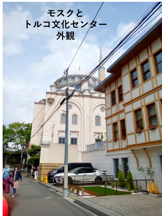
モスクと トルコ文化センター 外観