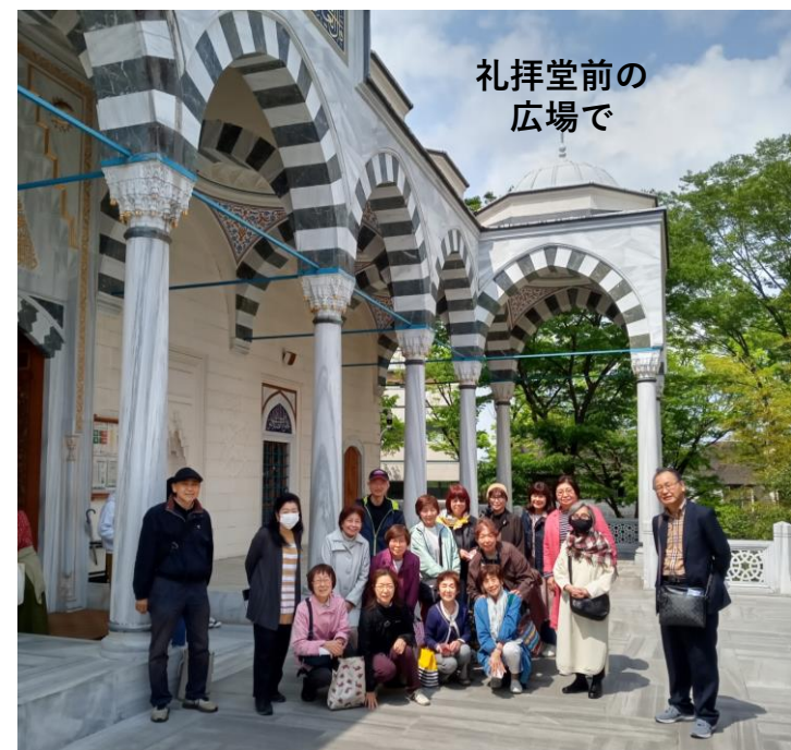
礼拝堂前の 広場で