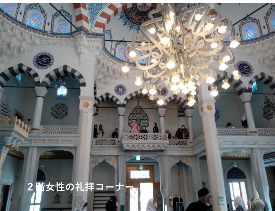
2階女性の礼拝コーナー