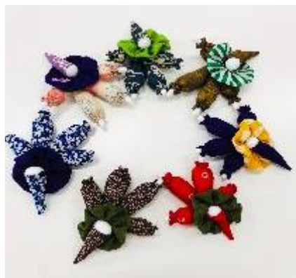
今月作る・ピエロのブローチ