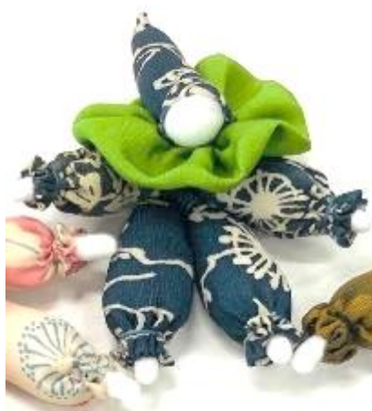
ピエロのブローチ