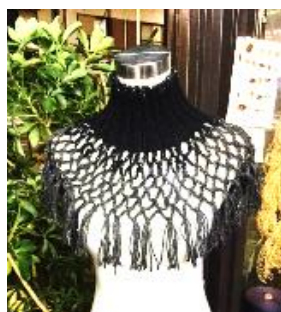
ネットクウォーマー