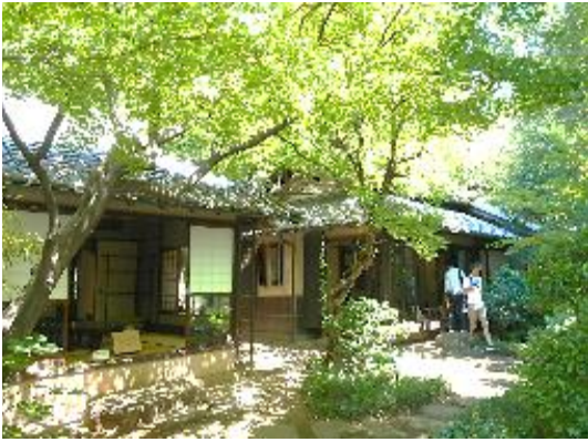
住居だったところ、現在記念館に