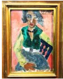
林芙美子は絵も描いた