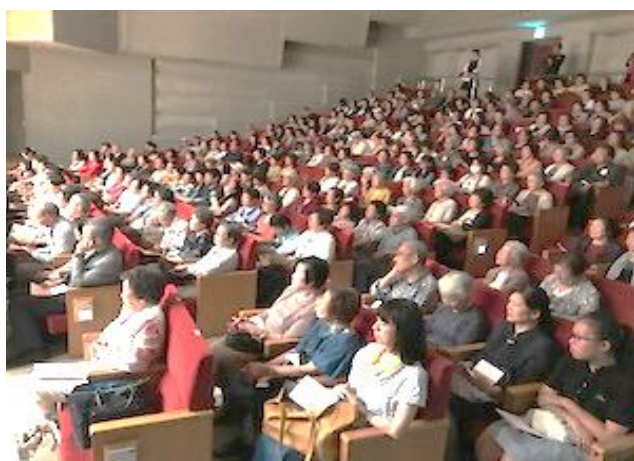
当日の観覧席風景