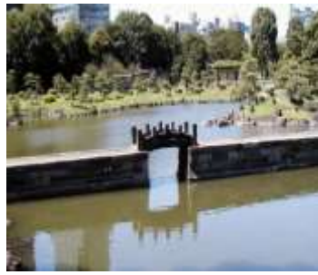
旧芝離宮恩賜庭園

裸婦には下半身に布が掛けられていたなど、例をあげればきりががない。今後のお勧め展覧会は「練馬発！日本のアニメ展」6月12日まで石神井公園ふるさと文化館、「三宅一生の仕事展」6月13日まで、「ルノアール展」8月22日までいずれも国立新美術館等です。