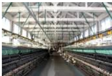
富岡製糸場(繰糸場)

◆詳細は4月号に同封の 申込チラシをご覧ください。 ※予定に入れて是非 ご参加下さい。